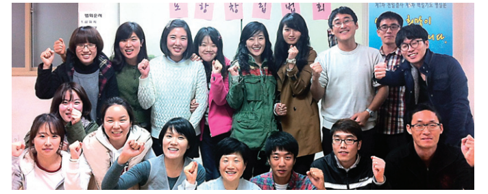
정도회 청년부는 전국적으로 청년부 활동을 확산시키고 있다. 사진은 포항 청년정도회 창립식 장면.