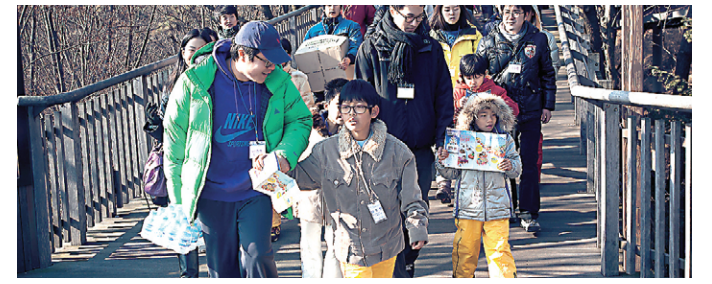
영108 회원들이 용인 청소년의 집 어린이들과 에버랜드로 나들이를 나간 모습.