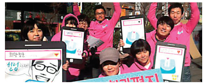
‘김제동이 어깨동무합니다’를 진행한 정도회 청년부가 홍보활동을 펼치며 포즈를 취하고 있다.