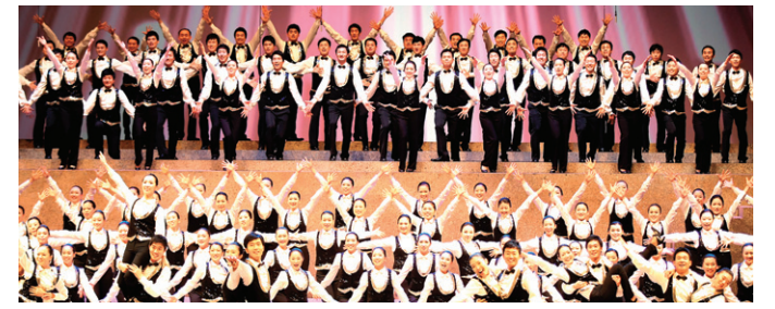
안양 한마음선원 청년회가 2011년 11월 ‘한마음음악제’에서 브로드웨이 뮤지컬의 한 장면을 선보였다.