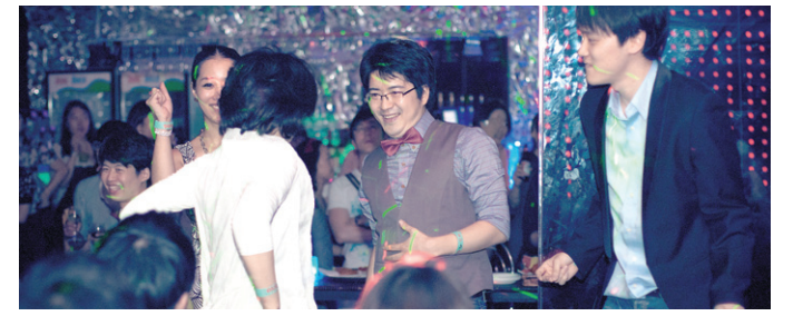
2011년 이태원에서 열린 ‘제1회 BIP 옴 파티’에서 여흥을 즐기는 영108 회원들.