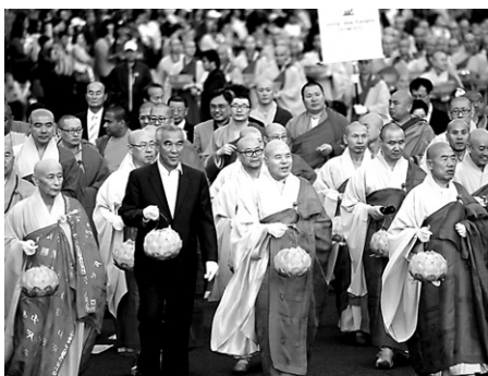
2012년 한해는 다사다난했지만 불교발전의 학계 노력이 결집된 한해였다. 왼쪽상단부터 시계방향으로 열반 100주기를 맞은 경허 스님(영상), 경허 스님에 대한 학문적 비판으로 폐간사태를 겪은 <불교평론>, 내장사 대웅전 화재와 부처님오신날 연등축제 장면