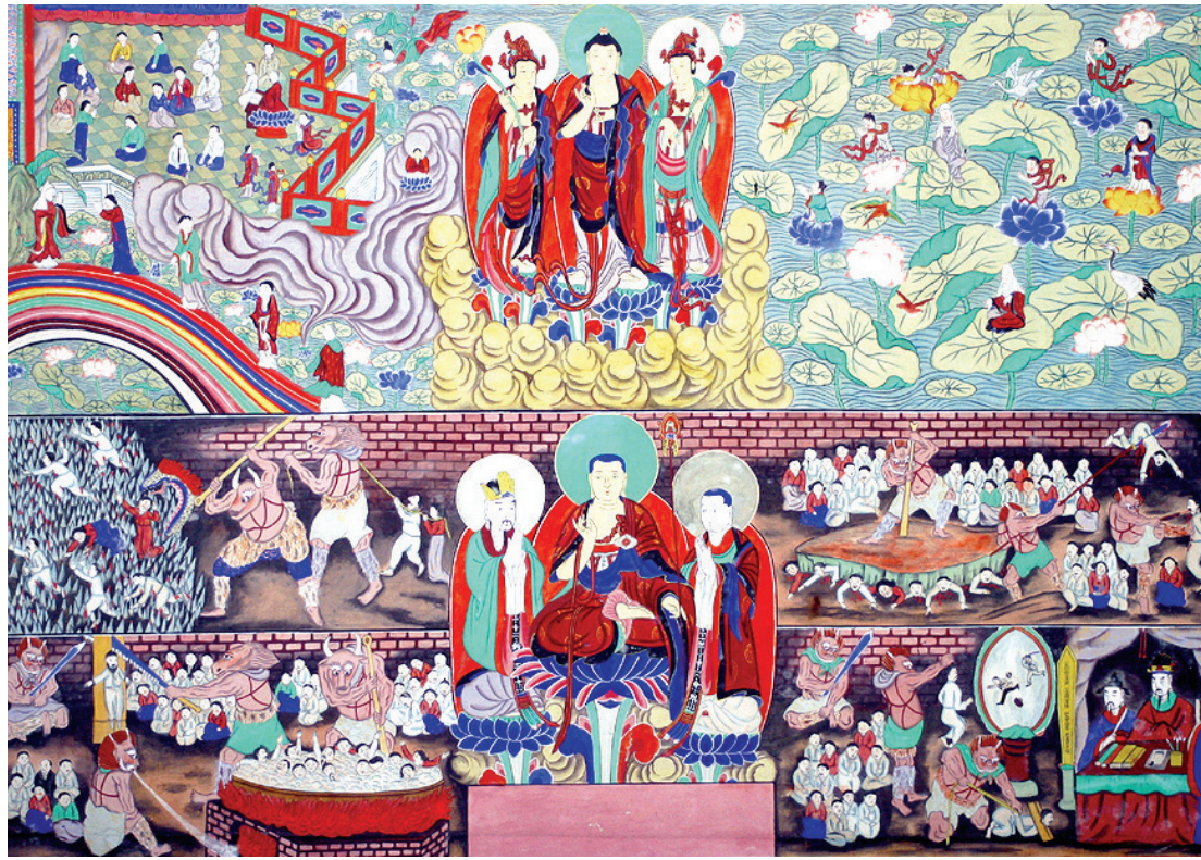
목아박물관 소장 지옥극락도. <경률이상>에는 불교 세계관의 수많은 설화를 주제별로 묶었다.

사자 꼬끼리 말 소 여우 이리 원숭이 고양이 쥐 기러기 비둘기 학 꿩 까마귀 용 뱀 거북 물고기 벌레