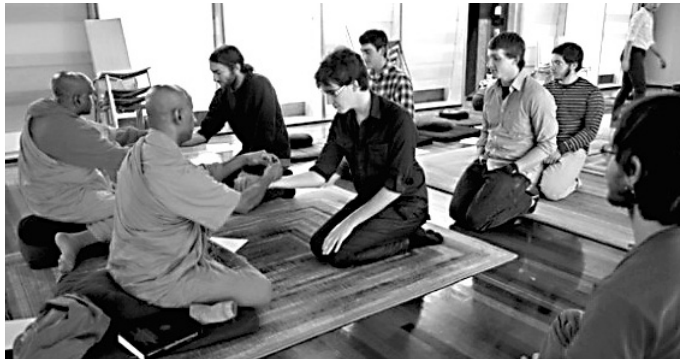
스리랑카 출신 스님이 노스이스턴대 학생들에게 불교의식을 행하고 있다. 미국과 영국의 대학생들은 명상수행을 통해 성적만을 좇지 않고 성품 키우는 데도 노력을 하고 있다.

이번 특강을 기획한 알렉산더 리버링 커튼(Alexander Levering Kern·집행위원)은 "우리는 매년 신입 회원들의 불교 소양