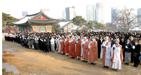
이운을 마친 스님들과 신도 500여 명이 고불식을 하고 있다.

글=이나은 기자 oasis1983@hyunbul.com