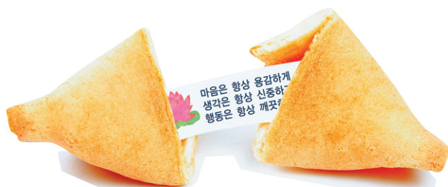
마음은 항상 윤희하게 생각은 항상 신중하게 행동은 항상 깨끗하게

이미 많은 사찰과 불교 단체, 기업 등 2,000여개의 곳이 포춘쿠키를 활용한 봉축행사, 템플스테이션, 어린이법회, 광고, 돌잔치, 결혼식, 전시회, 경품당첨 이벤트 등을 통해 효과를 경험했고, 미디어로서의 역할에 주목하고 있습니다. 또한, 식약청으로부터 검사, 통과 된 안심 먹거리입니다.