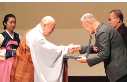
대상을 받은 민족사의 수상 장면.

조계종 문화부와 불교출판문화협회(회장 지홍스님)가 공동주최한 제 9회 불교출판문화상이 12월 12일 한국불교역사문화기념관에서 열렸다.