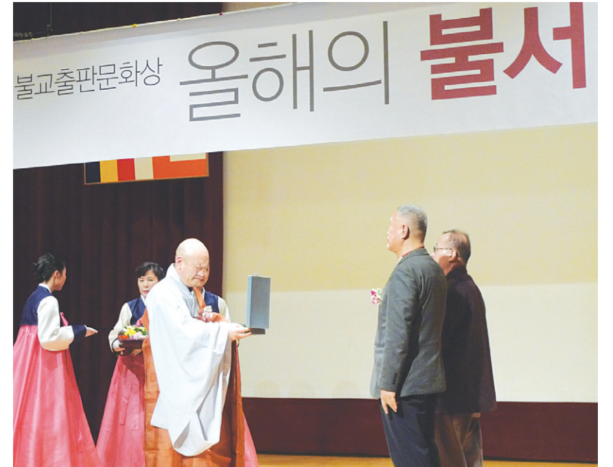
불교출판인들의 축제의 현장, 올해의 불서 10 시상식에서 『초기 불교의 사회적 실천』(김재영 저, 민족사 펴냄)가 올해의 불서 대상에 선정되었다.