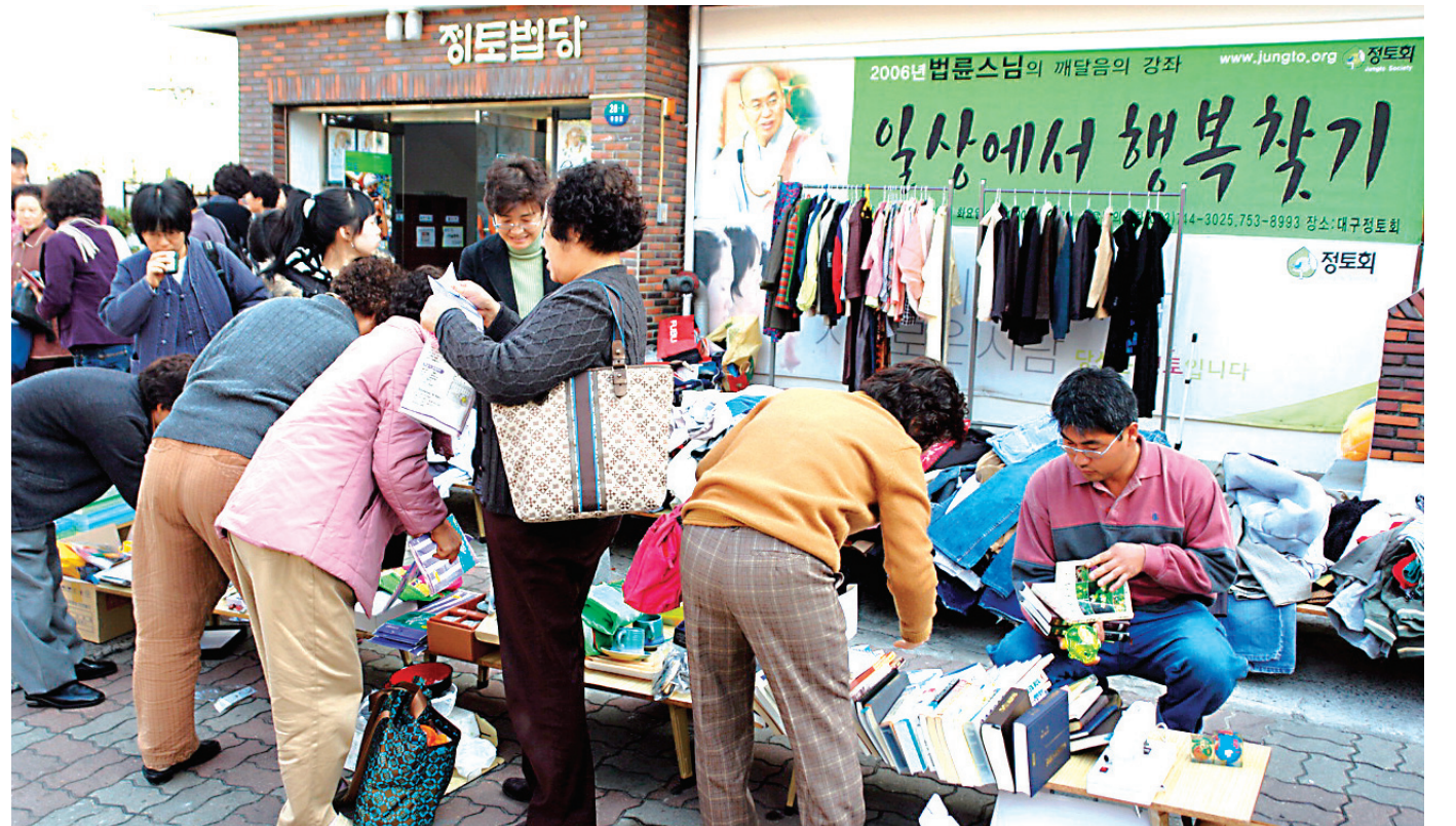
이제는 작은 지역단위에서 생산과 소비, 교환과 그리고 문화적 동질성을 이루며, 자연과 사람이 더불어 사는 공동체가 필요한 시점이다.