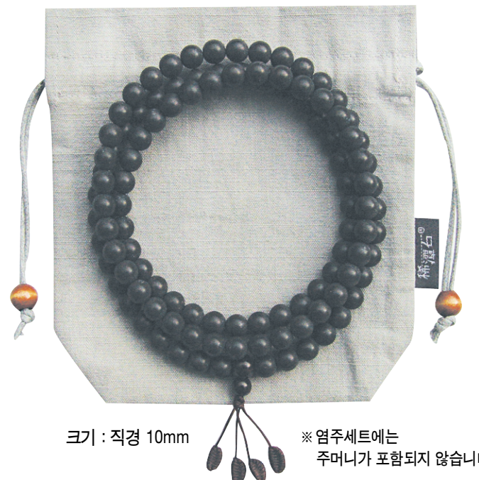
크기 : 직경 10mm ※ 염주세트에는 주머니가 포함되지 않습니다.