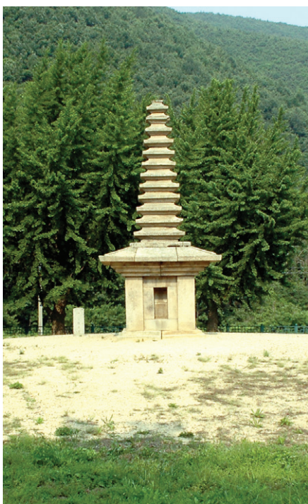
정혜사지 13층석탑 유적지 사진