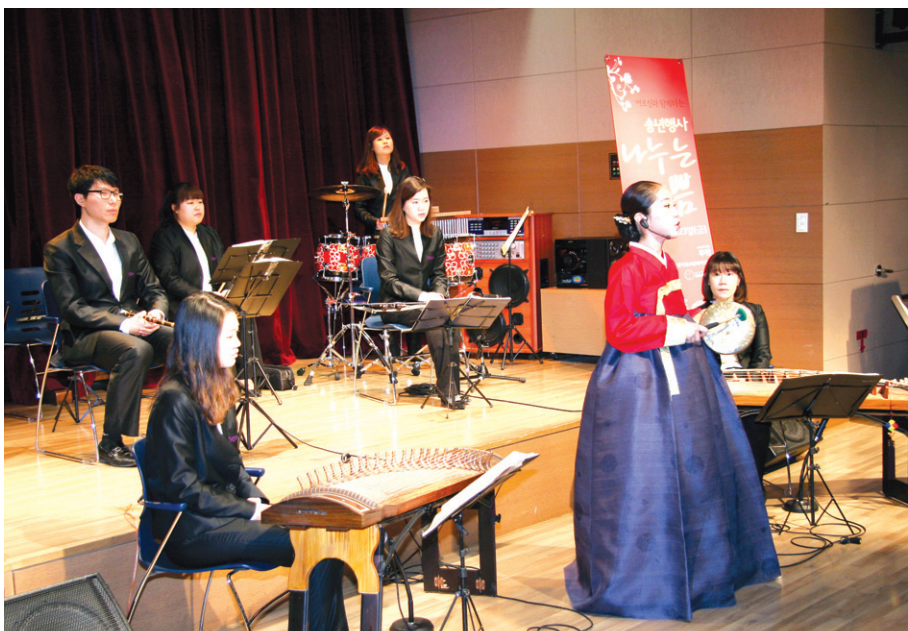
송년을 맞아 교계에서는 다양한 음악회가 열린다. 이웃과 나눔을 실천하는 공연에서부터 장애인과 함께하는 음악회까지 다양한 송년음악회를 한 자리에 모아봤다. 사진은 종로노인복지관의 2011년 공연 장면.