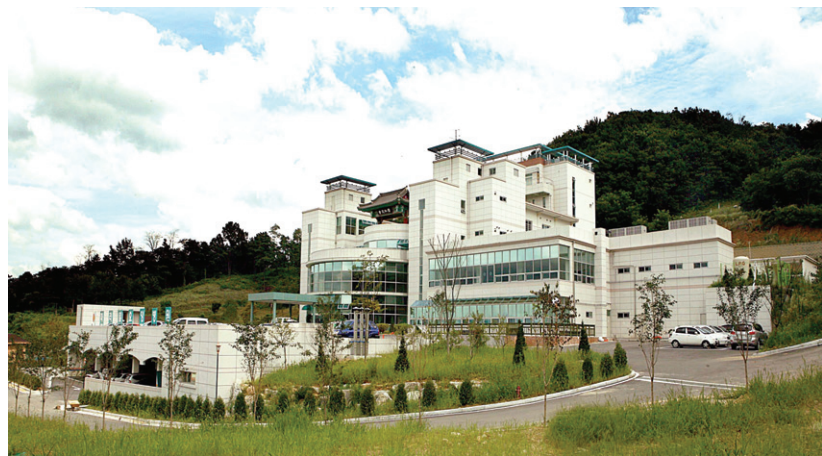
2008년 개원한 파라밀요양병원