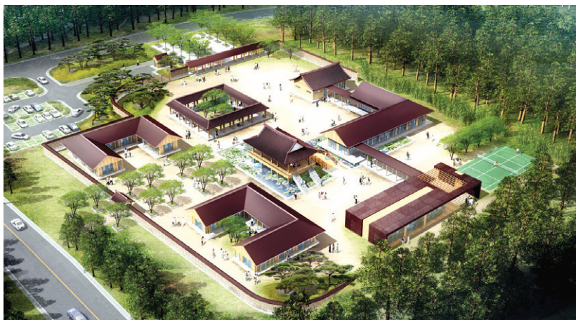
12월 12일 기공식을 갖는 베트남 '세종학당' 조감도

사자도 울고, 지린내 난다고 그렇게 싫어하던 할머니들도 울었다. 스님의 책 서문 뒤에 이어지는 사연들 속엔 스님과 언뜻마음이 반어반 아픈과 함께 나눈 눈물이 곁없이 이어졌다. 멀리 2008년에 힘겹게 완공되었던 파라밀병원이 보였다. 책을 덮고 스님을 만난다.