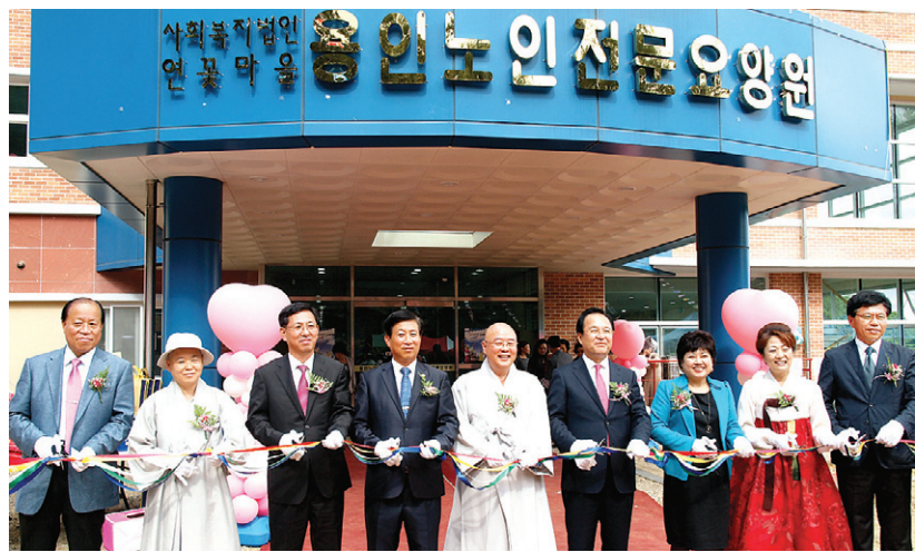
1993년 설립된 웡인 양로원이 2010년 웡인노인전문요양원으로 다시 개원했다.