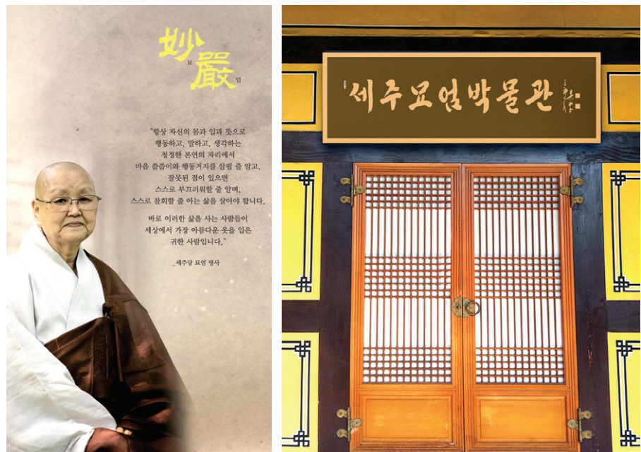
수원 봉녕사(주지 자연)는 12월 19일 묘엄 스님의 원적 1주기를 맞아 '세주묘엄박물관'을 개관한다. 사진은 박물관 입구 전경.

한국 비구니계의 대강백이며 최고 율사였던 세주 묘엄 스님 의 삶과 사상을 기리기 위한 박물관이 문을 연다. 수원 봉녕사(주지 자연)는 “오는 12월 19일 묘엄 스님의 원적 1주기를 맞아 ‘세주묘엄박물관’을 개관한다”고 밝혔다. 묘엄 스님이 생전 학인들을 대상으로 강의하며, 선방을 조성해 참선을 하던 향하당에 조성되는 세주묘엄박물관은 30여 평 규모