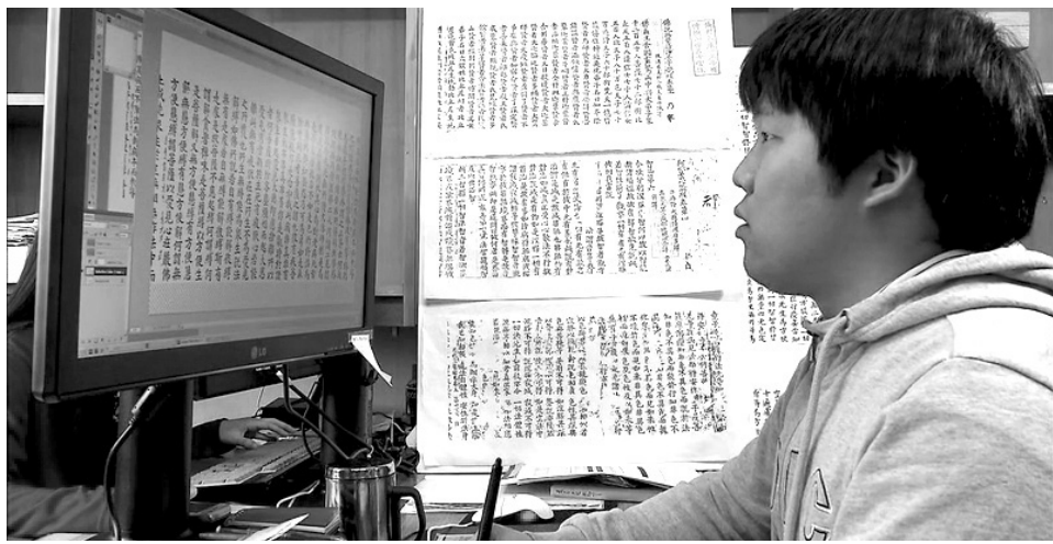
대구 MBC가 제작해 화제가 된 2부작 다큐멘터리 '고려 초조대장경'의 방송장면

부인사를 방치하는 것은 초조대장경에 대한 무관심이라고 해도 과언이 아니다. 따라서 부인사에 대한 재조명은 세계적인 목판인쇄술과 문화적 역량을 보여준 초조대장경의 역사적 가치를 정립하는 일이다. 대구 팔공산 부인사의 역사는 7세기, 신라 때로 거슬러 올라간다. 부인사는 왕조가 바뀌는 모습, 그리고 수많은 전쟁과 역사적 사건을 지켜보면서 변함없는 모습으로 천 년 역사를 이어 오고 있다. 또한 영남지역의 주요 고찰로서 그 위상이 드높았던 부인사는 협준한 산세와 더불어 북방에서 멀리 떨어져 있는 지리적 조건이 나라의 보물, 초조대장경을 보관하기에는 더없이 좋은 장소였다.