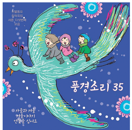
좋은벗풍경소리 35집 앨범 표지