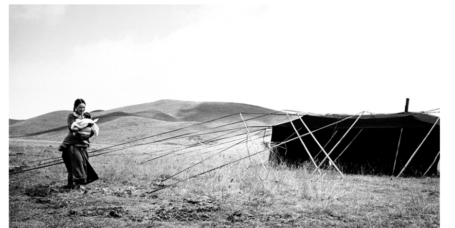
박노해 티베트 사진전 ‘남김없이 피고 지고’展이 2013년 2월 27일까지 종로구 부암동 라 카페 갤러리에서 열린다.