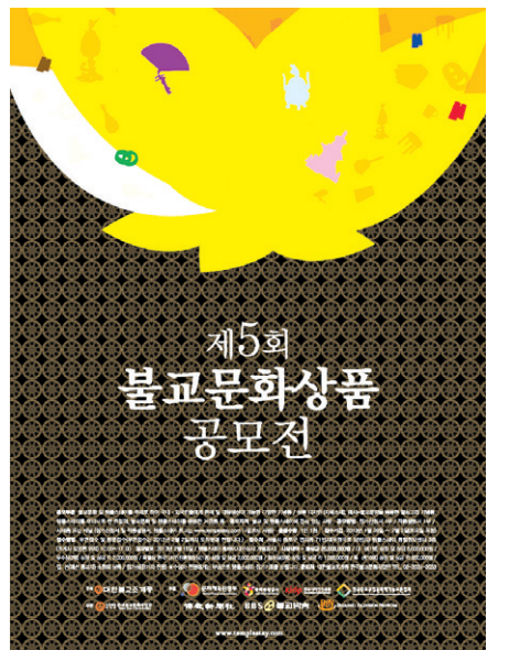
제 5회 불교문화상품 공모전 포스터

수상작품은 2월 25일부터 3월 5일까지 한국불교역사문화기념관 1층에 전시된다. 수상자 전원에게는 부상으로 템플스테이를 참여 기회도 선물한다. 신종일 기자