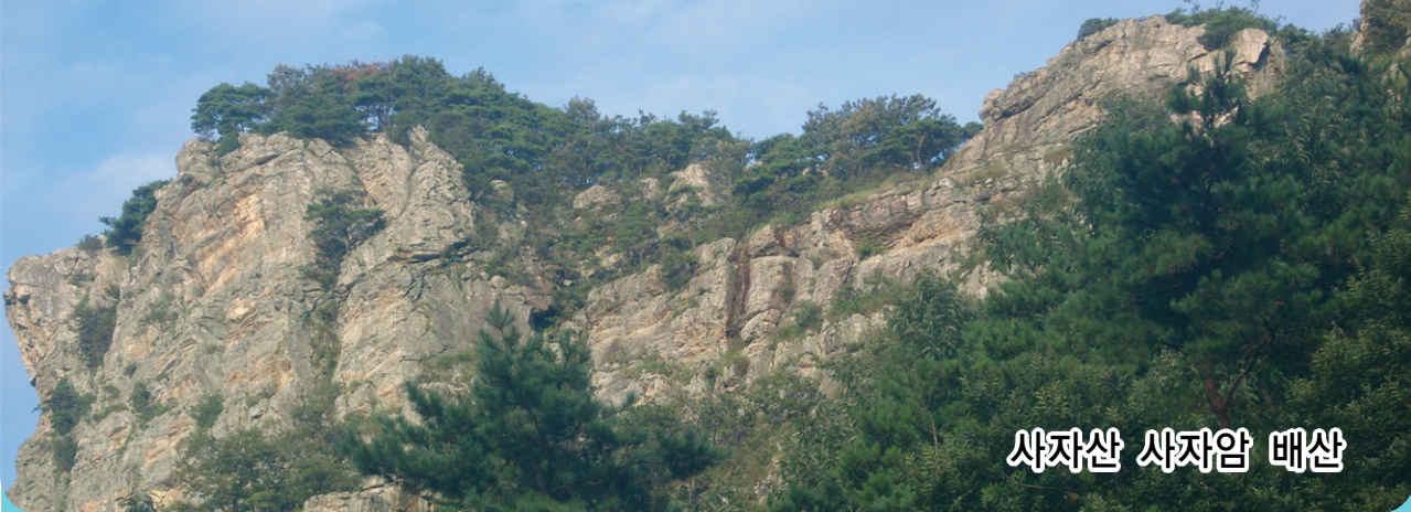
사자산 사자암 배산