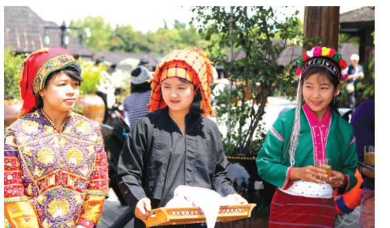
인레호수 인근의 소수민족 전통복장