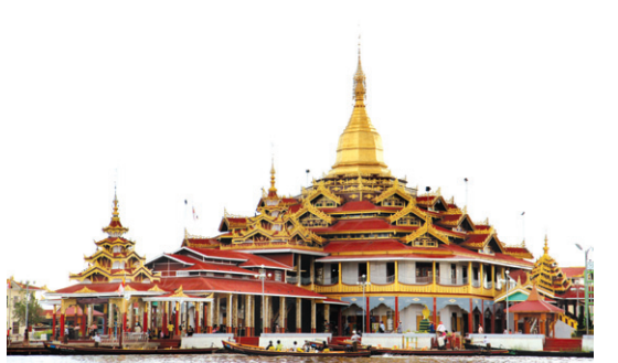
파웅도우 파고다는 배를 타고 가야한다.