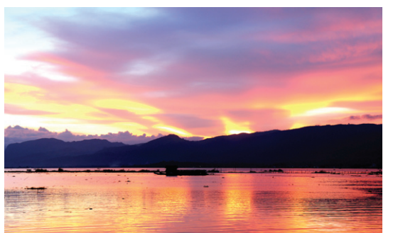
인레호수의 아름다운 석양과 고기잡이 배의 모습