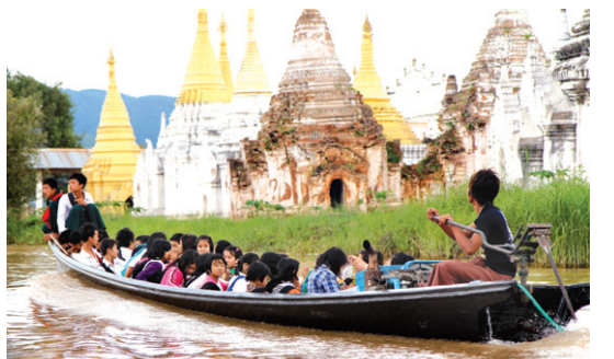
배를 타고 유적지 인근을 지나 등교하는 미얀마 학생들