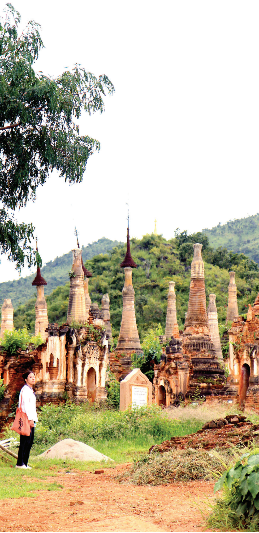
1000년 세월의 풍상을 보여주는 인떼인 파고다. 천년의 세월을 넘겨 견뎌온 흔적들이 곳곳에 남겨져 있어서 보는 이로 하여금 신비감마저 느끼게 한다.