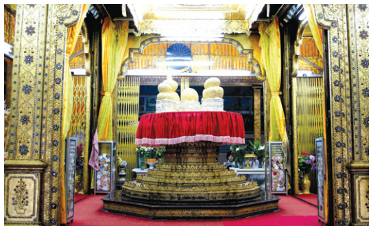
파웅도우 파고다의 다섯 불상