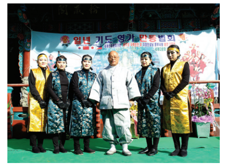
용주암은 11월 25일 세계 다문화 축제를 개최했다.

용주암 측은 "우리 사찰은 국제문화교류가 특별히 세계 각국의 공연단을 초청했