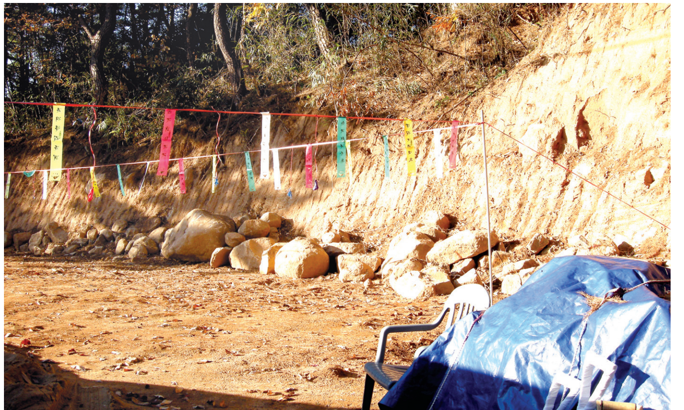
건물지를 터를 확보하기 위해 무리하게 실시한 토목공사는 자연환경의 훼손을 일으키게 되며, 산사태와 같은 환경문제의 원인이 된다. 경상북도 B 사찰