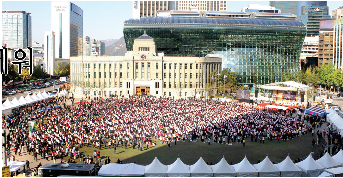
108산사순례기도회는 10월 31일 서울시청 앞 광장에서 1만여 명이 동참한 가운데 창립 6주년 법회를 봉행했다.