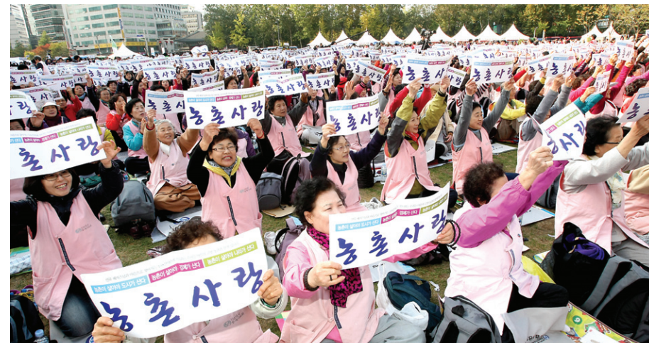
108산사순례기도회 회원들이 '농촌사랑' 피켓을 들고 즐거워하고 있다.