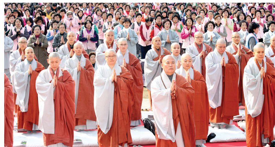
법회가 시작되자 회주 선목 해자 스님과 1만여 회원들이 108참회문을 봉독하고 있다.