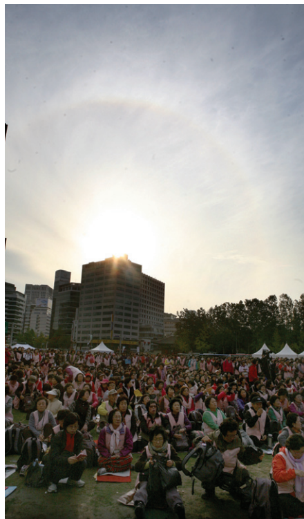
법회 중 모습을 드러낸 '일심광명'