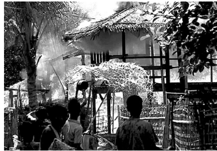
미얀마 시트웨에서 한 주민이 물을 뿌리며 불타는 가옥에 대한 진화 작업을 벌이고 있다.

동남아시아국가연합 아세안의 수린 핏수완 사무총장은 미국의소리(VOA)를 통