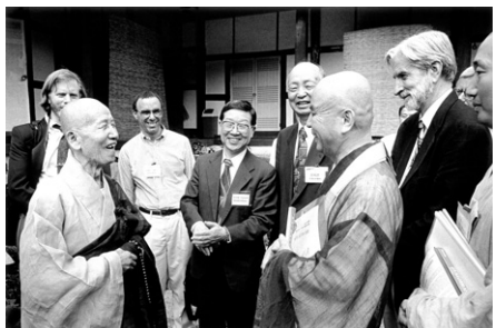
국제무차선회서 학자들과의 담론