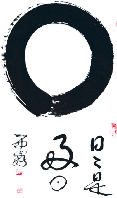
서용 스님 유묵 '일일시호일원상'