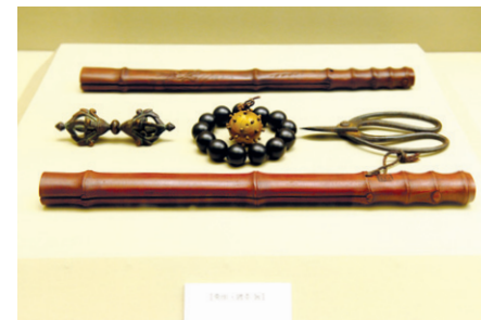
사진·유품 전시의 서용 스님 족비, 엄주