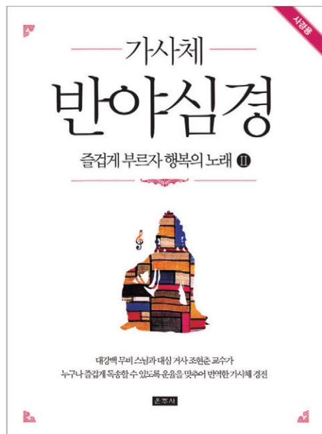
무비 스님·조현춘 공역/사륙배판/88쪽/5,000원