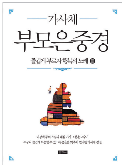
무비 스님·조현춘 공역/사륙배판/100쪽/5,000원