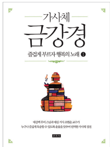
무비 스님·조현춘 공역/사륙배판/96쪽/5,000원