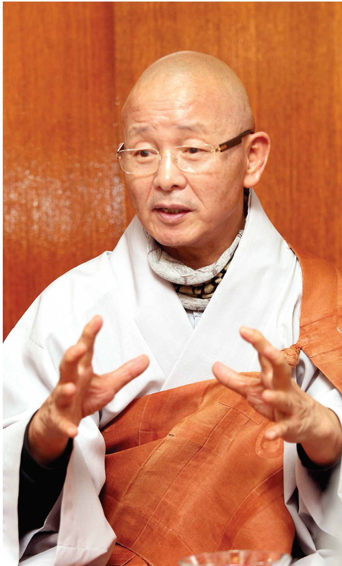
혜총 스님은 ... 1943년 경남 통주에서 태어나 1953년 통도사에 입산. 보경 스님을 은사로 자운 스님을 계사로 사미계, 동산 스님을 계사로 비구계 수계. 해인사와 범어사 승가대학 졸업. 동국대학교 불교학과 졸업 및 동 대학원 수료. 1964년 지호 스님에게서 건당(建幢). 당대 율사 자운 스님을 40여년 모셨다. 2011년 11월 까지 제5대 조계종 포교원장을 역임했으며 현재 부산 감로사 주지, 사회복지법인 불국토 대표이사 등의 소임을 맡고 있다. 저서로 <꽃도 너를 사랑하느냐>, <새벽처럼 깨어 있으라>, <공양하는 마음> 등이 있다.

前 조계종 포교원장이자 부산 감로사 주지 혜총 스님을 만나는 자리는 항상 웃음꽃이 핀다. 자그마한 체구에 어울리지 않는 스님의 걸걸한 입담과 위트, 재미있게 풀어주는 부처님 이야기는 귀를 즐겁게 세우고 들을 수 밖에 없는 매력이 있다. 무엇보다 천진하게 웃는 스님의 모습은 만나는 이로 하여금 즐거움을 준다.