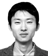
주성원의 기초 교리 41