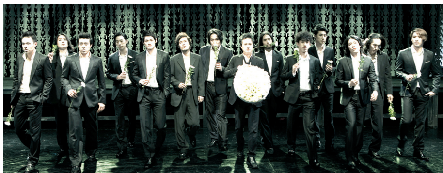
삼국유사의 '도화녀와 비형랑' 설화를 모티브로 한 '로맨티스트 죽이기'가 11월 24일-12월 9일 백성희장민호극장에서 막을 올린다.

설화에 따르면, 비형은 여우로 변신해 도망친 도깨비 '길달'을 잡아 '축귀(逐