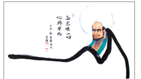
경암 스님의 '달마도'

이번 전시는 지난 11월5일부터 7일까지 사흘간 서울 국회의사당 전시 이후 불