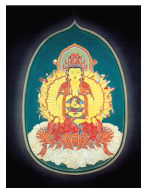
도행 스님의 '사십이수 관음도'