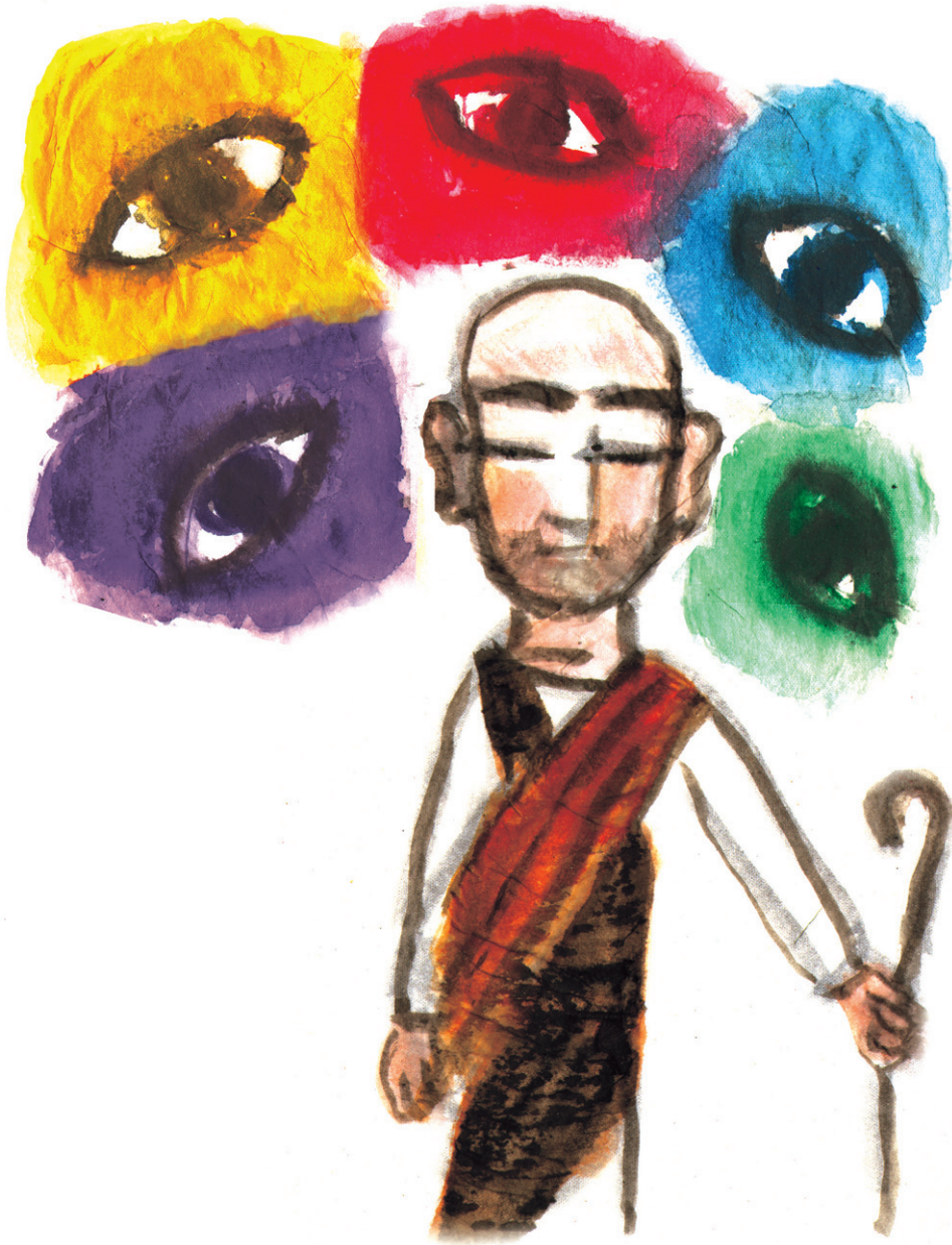
그림 · 김홍인

기원정사. 부처님의 설법이 이어지고 있었다. 그때, 설법을 듣고 있던 아나울은 졸음이 밀려와 졸고 말았다. 그 모습을 본 부처님이 아나울에게 다가가 말씀하셨다. "아나울아 너는 어찌하여 이 법의(法義) 가운데 잠을 자고 있느냐? 벗어, 그대는 진리를 찾아 출가한 것이 아니었던가. 그 첫 마음은 어디에 있는가?" 놀란 아나울이 잠을 깨며 말했다. "편목 없습니다." 그토록 출가의 뜻이 컸던 아나울이었지만 수행자로서의 생활이 순탄하지는 않았던 것이다. 부처님의 엄한 경책에 아나울은 부처님 앞에 엎드려 서원한다. "이 순간부터 저는 결코 잠을 자지 않겠습니다." 아나울은 그 시간 이후로 눕지도 잠을 자지도 않는다. 부처님과의 약속을 지키기 위해, 자신과의 약속을 지키기 위해 그는 고행을 시작했다. 아나울이 격정된 부처님과 대중은 그를 말렸다. 하지만 그는 부처님 앞에서 한 맹세를 지키겠다며 잠을 자지