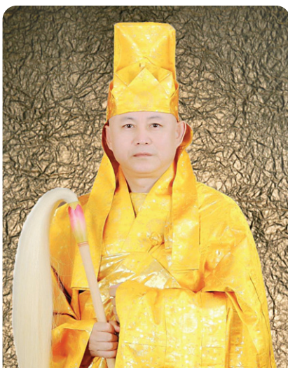
석가여래부족법 제 77세 청봉 석정산 대중사