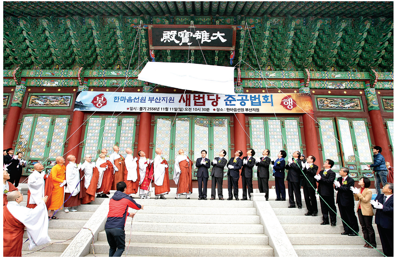
위용 드러낸 한마음선원 부산지원 새법당

수국사 주지 원담 스님을 비롯한 대표 스님들은 "제도 도입에 있어 사찰행정력과 현실성을 고려해달라"고 주문했다. 노덕현 기자