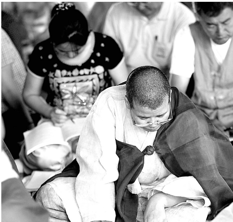
2006년 8월 동화사 계율수행대법회에서 출세가가 함께 공부하는 모습

정 교수는 "최근 꾸준히 제기되는 한국 불교 개혁 방안에 빠지지 않는 것이 재가 불자의 사찰운영 참여"라며 "하지만 지속적인 요구에도 관철되지 않는 이유는 그 권한이 출가에 있기 때문이며 결과적으로