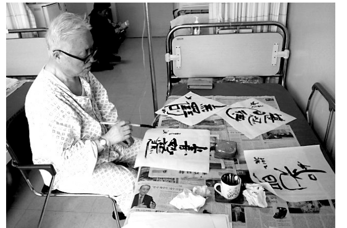
상계백병원 병실에서 법사회 회원들을 위해 서예를 하고 있는 목교수

10월 6일 | 다녀가는 분도 많다. 고마운 마음이 가슴 깊이 깊이 자리 하나. 내 다 시 나으면 그들 마음의 바라밀로, 살아가야 하리라.