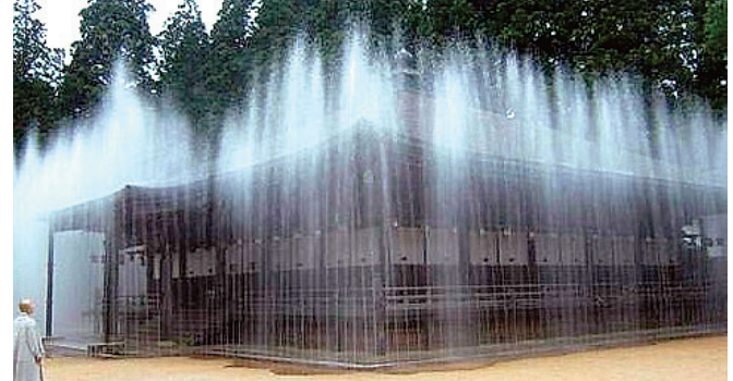
일본 고야산 미네지는 명속 노출 수막 시스템을 통해 전각을 화마로부터 보호하고 있다.