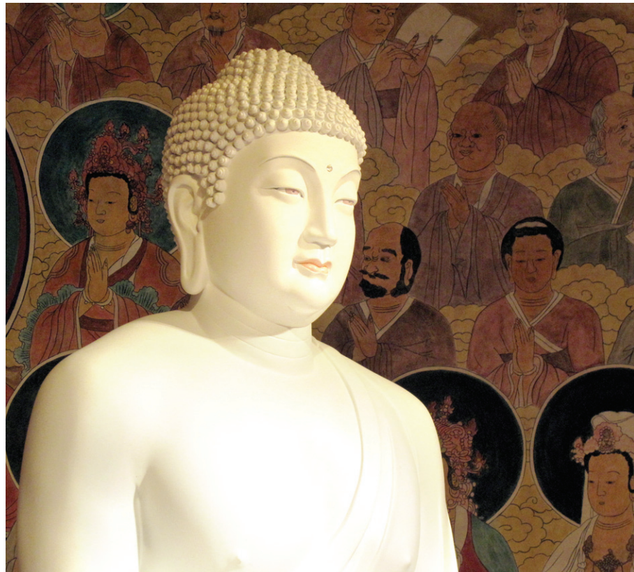
백색도료를 사용한 석가모니불좌상 뒤로 프레스코화 기법을 활용한 불화가 보인다.

조각 작품을 담은 주불 등 5개의 불상에서는 위압적인 권위를 느낄 수 없다. 석가모니불 양 옆의 문수, 보현, 관음, 지장 보살은 각각 아이들 남녀 가수, 친근한 아줌마 아저씨의 얼굴을 형상화했다. 두상을 지나치게 크게 만들었던 기존의 불상과 달리 인체 비례도 균형을 잡았다.