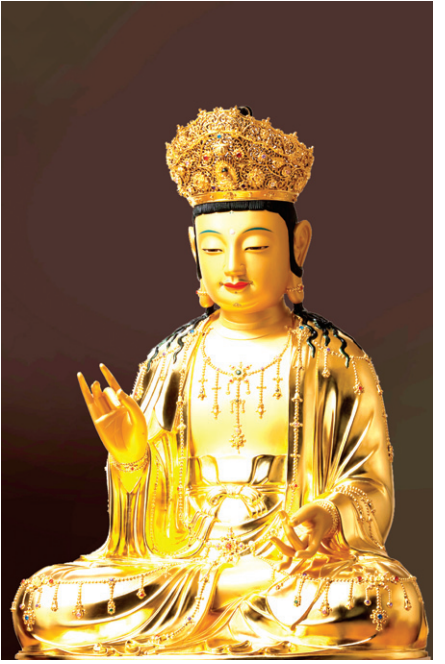
이진형 작 '관세음보살상'