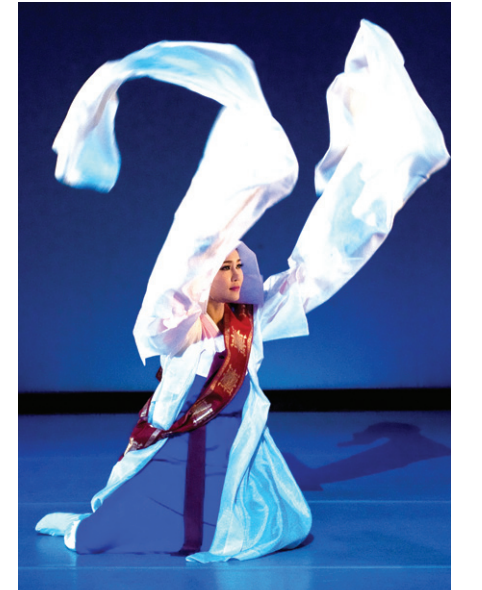
춤매는 11월 20일 남산국악당에서 전통과 현대를 아우르는 공연을 연다.