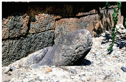
울진 불영사 대웅보전을 받치고 있는 돌거북

낙산사 불사를 하면서 특히 신경을 쓴 부분이 있는데, 스토리텔링을 위한 문양과 디자인 등이었다. 어른 스님들은 문화재에 대한 감각은 없으신지 기안을 내면 반대하는 경우가 많아, 담당자들이 장인들을 설득해서 단청이나 석물들을 디자인을 조율했다.