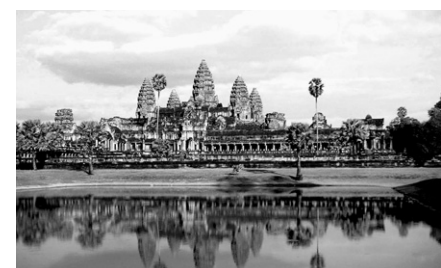
세계 7대 불가사의 중 하나인 양코르와트 사원

세계 7대 불가사의 중 하나인 캄보디아 양코르와트를 구성하는 거대 돌의 미스터리가 밝혀졌다.