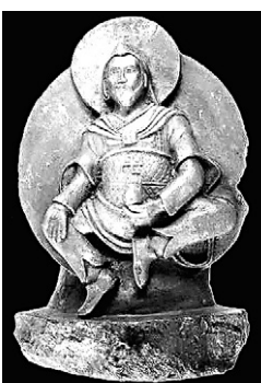
1000년 전에 만들어진 것으로 추정되는 사천왕상이 모조품이라는 주장이 제기됐다.

이 불상이 모조품이라는 것은 불상전문가인 중국대 불교학부 아킵 바이어 교수에 의해 밝혀졌다. 바이어 교수는 최근 발표한 온라인 보고서를 통해 "모조품의 특징으로 불상이 신고 있는 신발은 유럽형의 신발 모양을 하고 있다. 또한 승복 대신 바지를 입고 있으며, 관 모양의 대는 티베트와 몽골의 전통 의상과 다른 형태"라며 "또 티베트나 몽골 불상에서는 볼 수