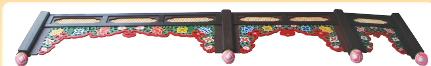
대웅전, 산신각, 포교당, 소법당 등의 천장에 누구나 간편하게 직접 조립할 수 있게 제작

전통적인 연꽃 단청과 문창살문양으로 부처님을 모시는 법당을 보다 장엄하게 설치하도록 제작하였습니다.