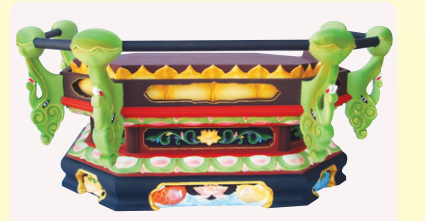
원목 부처님 좌대 (2자 반 기준)