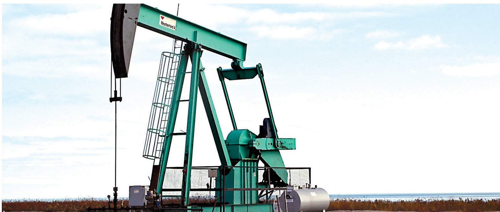
원유를 시추하기 위한 기계들. 무분별한 시추로 북극해는 녹아내리고 있으며, 자원 사용의 불균형을 야기 시켰다.