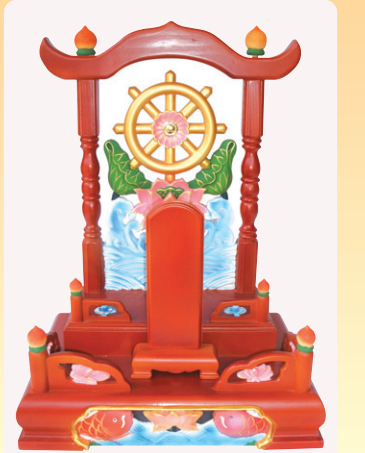
원목 영가 사진을 위해