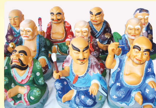
16나한상 (높이 30cm)