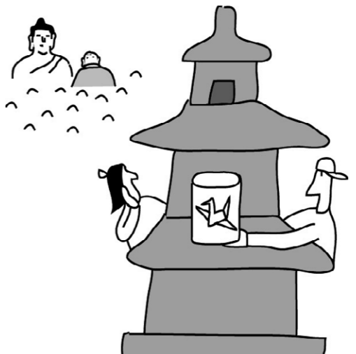
그림 · 박구원