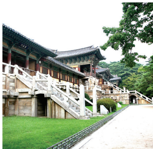
초의 스님이 추사와의 재회를 기다렸던 불국사 전경

초의스님은 학림암에서 추사를 처음 만난 후, 첫 만남의 설렘이 식지 않은 듯, 불국사에서 추사와의 재회를 오매불망 기다렸지만 허사가 되고 말았다. 그가 지은 <불국사회고>는 추사를 향한 그의 마음을 집약할 수 있는 시로, 그 정회(情懷)를 이렇게 노래했다.