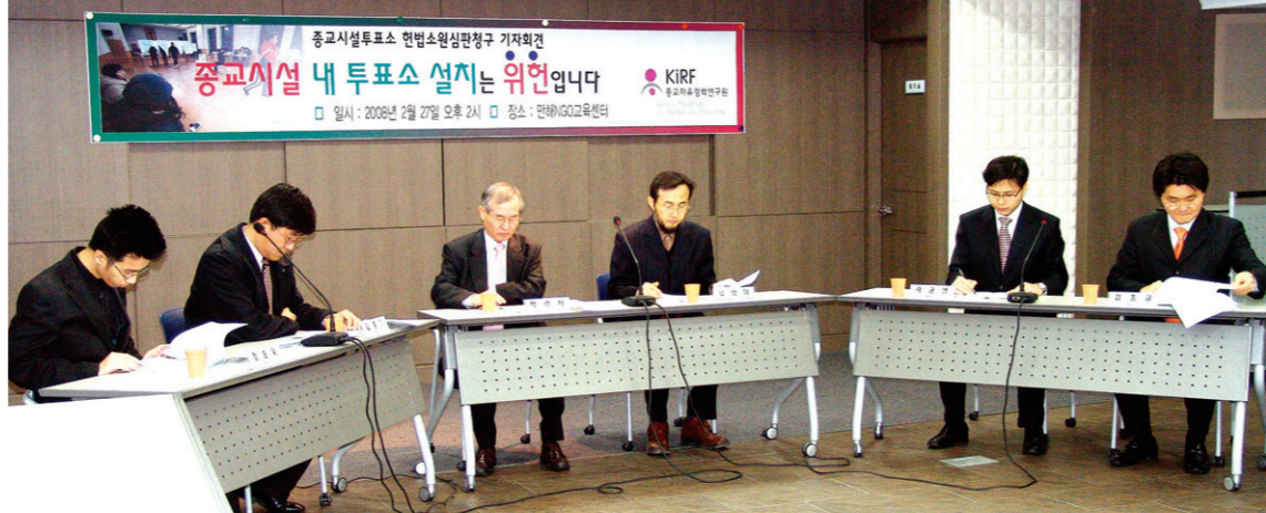
박 교수는 종교자유정책연구소 설립 한국 사회 종교 자유의 문제를 이슈화 시키고 이를 바로잡아 가는 노력을 기울이고 있다. 사진은 종자원이 주최한 종교서설투표쇼 현상조사 심판청구 관련 기자회견.

그는 다종교 사회 대한민국에서 개인의 종교 때문에 불이익을 당하는 것은 인권침해라고 말한다. “우리 헌법 20조에 명기된 바와 같이 종교의 자유는 어떠한