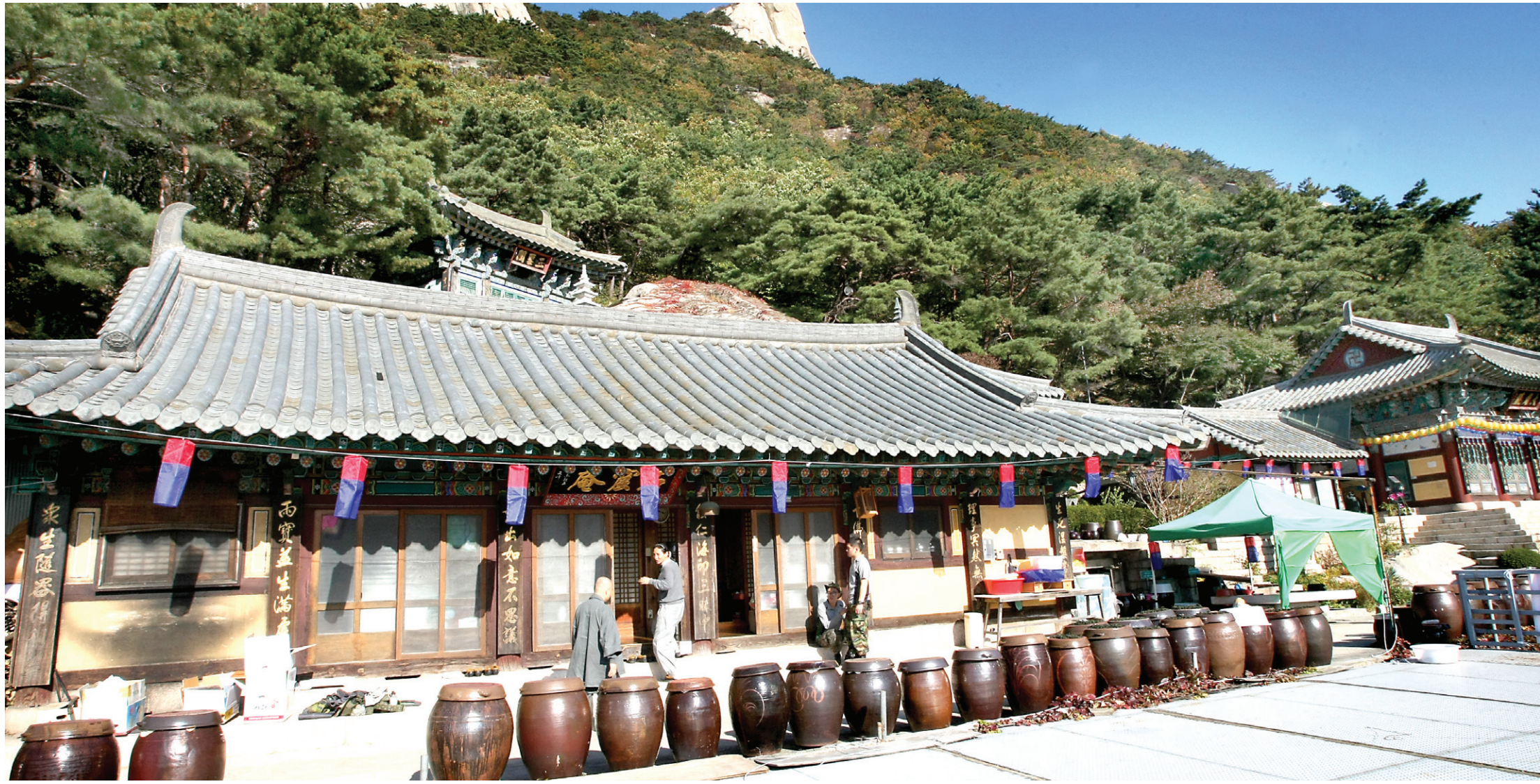
오봉산 관음암 종턱에 자리잡은 석굴암. 10월 20일 예정된 단풍음악제 준비로 도량이 분주하다. 인근 군부대 장병들이 울력을 나와 음악제 준비를 돕고 있다.