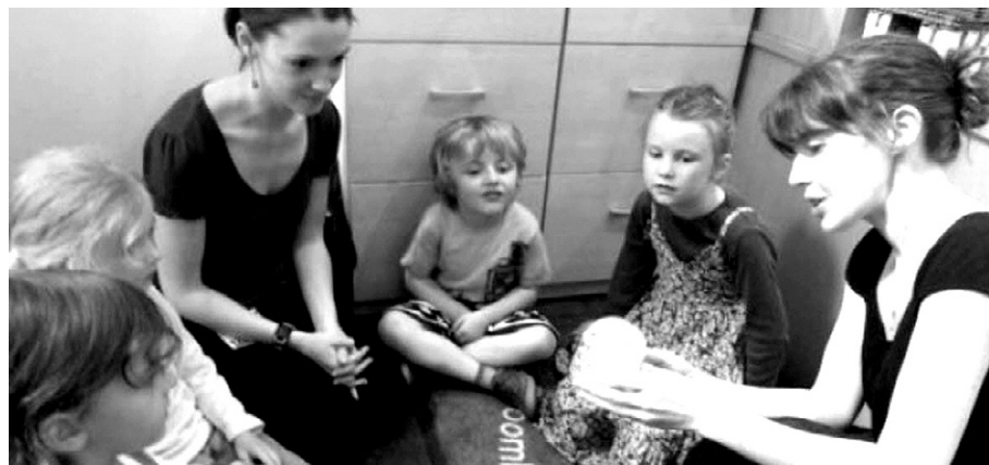
셰필드 유치원·초등학교가 어린이들을 위해 ‘상상력 연습’을 가르치고 있다. 아이들은 어떤 이미지를 상상하게 하고, 그것의 변화를 지켜보면서 자신을 반성하고 치유하는 계기로 삼는다.

또한 리사메리 박사는 “교육 내용은 단순하지만, 그 결과는 대단히 효과적”이라며 “초등학생들이 자신의 인식의 폭을 넓