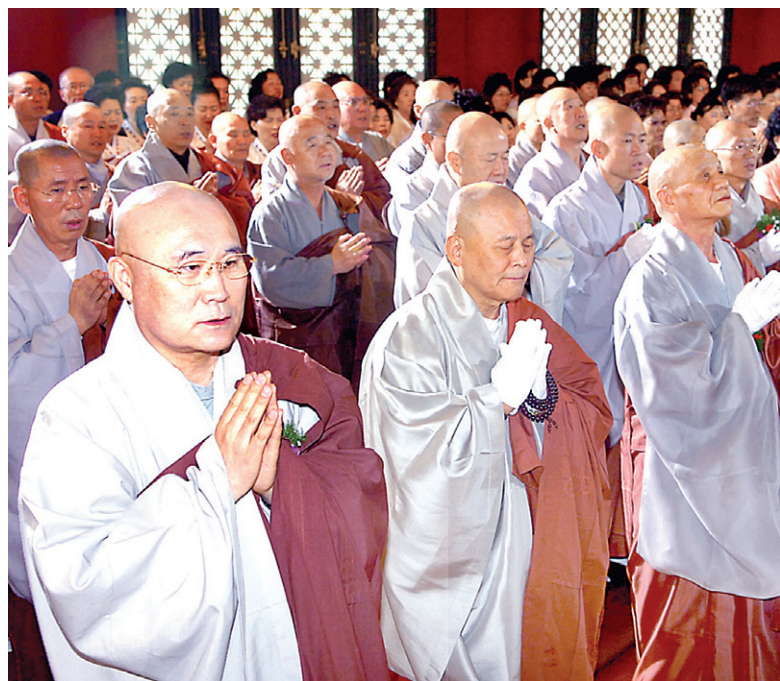
경기도 양주 도리산 육자장사. 15년 전, 주5일근무제를 대비해 도심서 벗어나 템플스테이와 다양한 수련회를 통해 문화적 수행과 포교를 실천하기 위해 창건된 도량이다. 사진 왼쪽은 1997년 육자장사 창건 법회 장면. 오른쪽은 육자장사 전경.