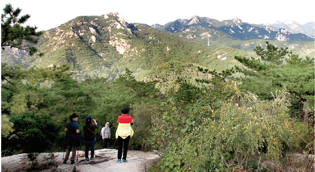
서울시가 전망명소로 지정한 옛성길 전망대에 서면 북한산의 봉우리들이 한 눈에 들어온다.