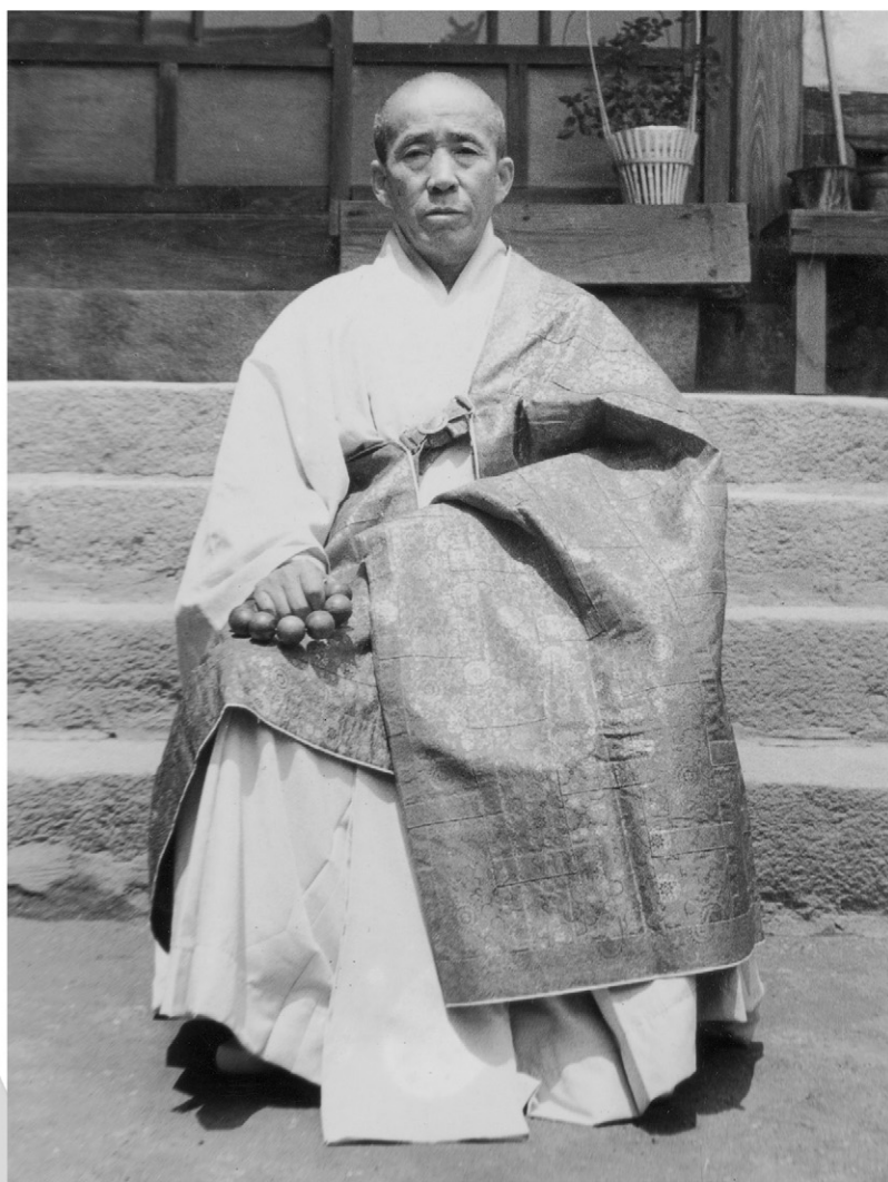
열반 전의 태허 조사