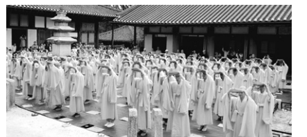
태고종은 9월 26일 선암사에서 합동득도수계식을 봉행했다.

이날 수계행차는 지난 9월 5일부터 3주간의 연수교육을 통해 예경의식, 불교기초교리, 초발심사경문 등을 이수했다. 또한 3주간 매일 새벽 3시부터 새벽예불과 정근, 강의, 운역, 참선수행, 저녁예불 및 참회 정진 등의 교육일정과 수계식에 앞서 18일에는 경내 중간부도탑에서 대웅전앞 특설도량까지 1.2Km를 일보일배 했다. 양행선 광주지사장