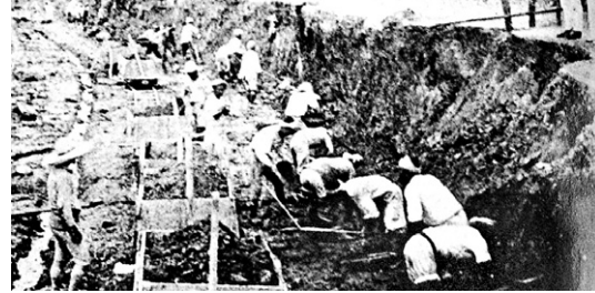
강제 부역에 동원된 조선인

"일본의 남쪽 규슈 탄광 지대의 지하 깊은 막방에는 지금도 무참히 희생된 수많은 동포들이 원한을 품은 채 파묻혀 있습니다. 재일동포는 이러한 민족 수난의 역사를 전하는 산 증인이라고 할 수 있습니다." 책은 조국을 빼앗기고 해방이 되었어도 조국에서 살 수 없었던 재일동포의 힘겨운 역사를 이야기 해준다.