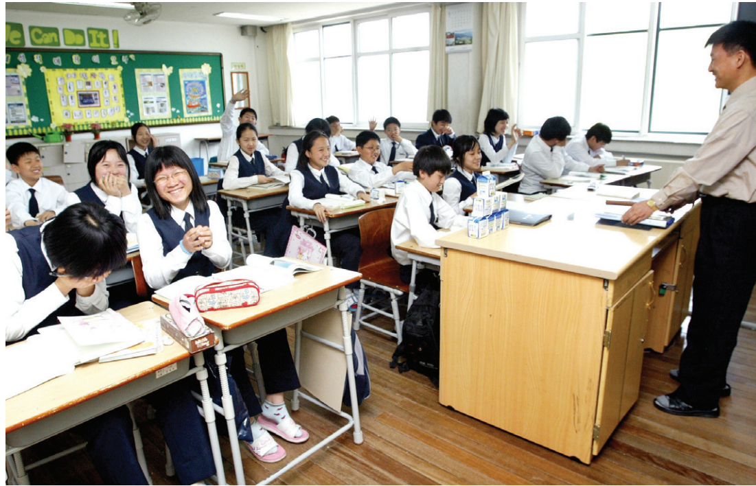
저자는 왕따문제를 해결하려면 사회전체가 문제를 인식하는 일이 선행되어야 한다고 말한다.

이 움직여야 한다."고 말한다. 어떻게 문제를 해결해야 할까? 책은 두 가지를 말한다. 하나는 사회 전체의 왕따 문제에 대한 인식의 재고이다. 왕따 현상이 학교뿐만 아니라 직장, 학교, 군대 등 전 사회에 만연해 있다는 심각성을 구성원 모두가 인식해야 한다는 것이다. 또 하나는 어른들의 책임 의지이다. 왕따 문제가 심각하더라도 어른들은 책임을 미룰 뿐 마음을 모아서 해결하려는 의지를 보이지 못하고 있다. 교사, 부모, 상담가, 지역사회 구성원 등 모두의 집중적인 결의와 노력이 필요하다는 것이다. 총 4개의 장과 사례 모음으로 구성되어 있는 책은 왕따 문제를