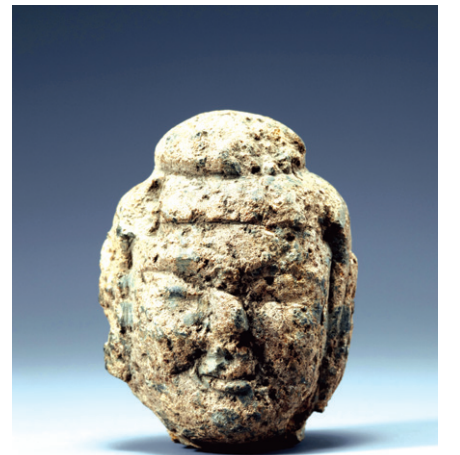
부여 부소산 출토 '부처 얼굴'

또한 백제 중흥을 도모했던 제26대 성왕(聖王)의 흉상을 복원, 역사 속 백제인을 되새겨보는 자리가 마련된다. 그리고 1995년 국립부여문화재연구소가 발굴조사한 부여 능안골 고분에서 출토된 인골