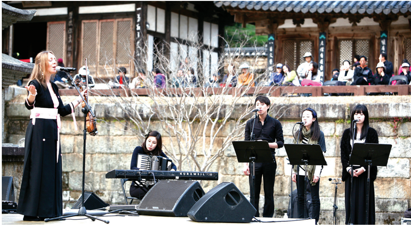
10월 각 사찰마다 풍성한 산사음악회가 마련돼 우리의 마음을 설레게 한다. 사진은 지난해 개최된 화엄사의 '화엄제'