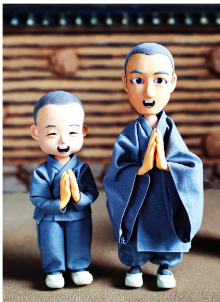
한국불교문화사업단이 개발한 클레이애니메이션