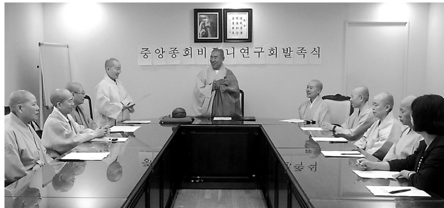
조계종 중앙종회 비구니의원 스님들은 9월 19일 연구회 발족식을 개최했다.

향후 비구니의원 연구회는 ▷비구니 승가의 올바른 위상 정립 관련 사안 연구 및 조사 활동 ▷비구니 의원 전문성, 자질 향상 ▷재가여성불자들이 실행 활동 지원 등을 추진할 계획이다. 신종일 기자