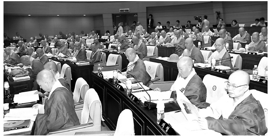
9월 18-19일 열린 조계종 중앙종회 191회 임시회에서는 10.27 법난위원회 정상화를 촉구하는 의원 스님들의 질의가 이어졌다.

중앙종회는 "국방부가 위원회에 파견한 지원단이 10.27법난위 자료 공개를 거부하고 있는 것은 이명박 정부가 법난을 축소하고