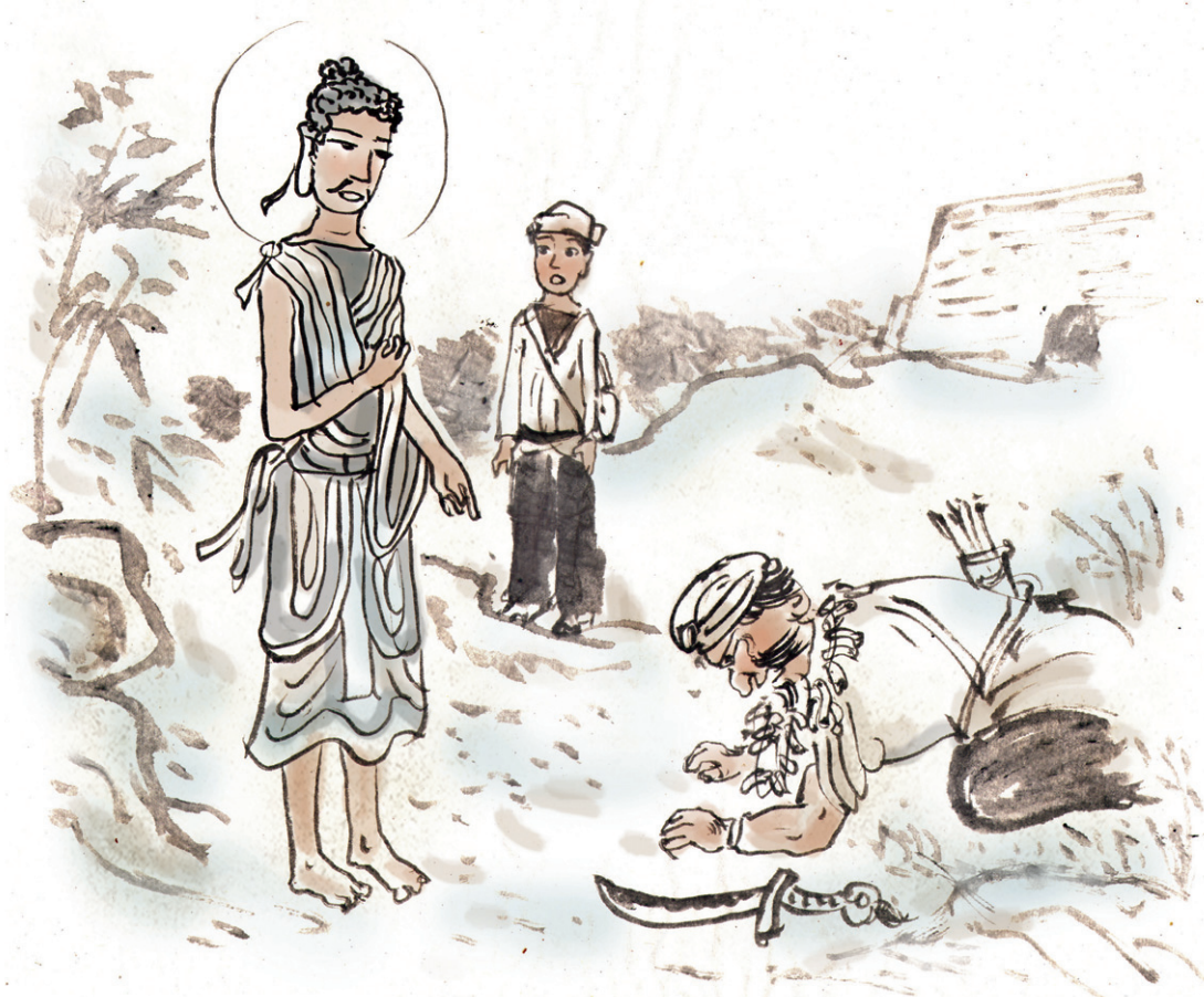
그림 · 김홍인

어느 날 아침, 부처님은 돌이킬 수 없는 길로 접어들어 늪에 빠진 이들을 염려하면서 신통으로 세상 곳곳을 살펴보고 있었다. 그러던 중 사위성 근처 숲에서 괴범벽이 돼 돌아다니는 양굴리말라를 발견했다. 그는 부처님 당시 코살라국 수도인 사위성 주변에서 살인을 일삼으며 세상을 어지럽히던 살인마였다.