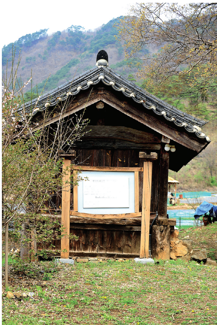
강원도 제132호 문화재 자료로 지정된 영월 보덕사 해우소(사진 왼쪽)와 선암사 뒷간(사진 오른쪽). 우리나라에서 가장 아름다운 절집 해우소들이다. 사찰 화장실은 해우소(解憂所)로 알려져 있으나 근래에 와서 붙여진 이름이고, 원래는 정량(淨廊), 청축, 뒷간이라고 부른다. 순환적 삶을 보여주는 대표적인 예다.

사람들은 물은 위에서 아래로 흐른다고 말한다. 그 '위'는 계곡상류이고 또한 깊은 산속의 샘에서 시작된다. 그래서 산속 계곡에서 흘러내려가 내를 이루고 강에 이르러 바다로 간다고 생각한다. 이렇게 흐르는 물길을 되돌릴 수 없다고 생각한다.