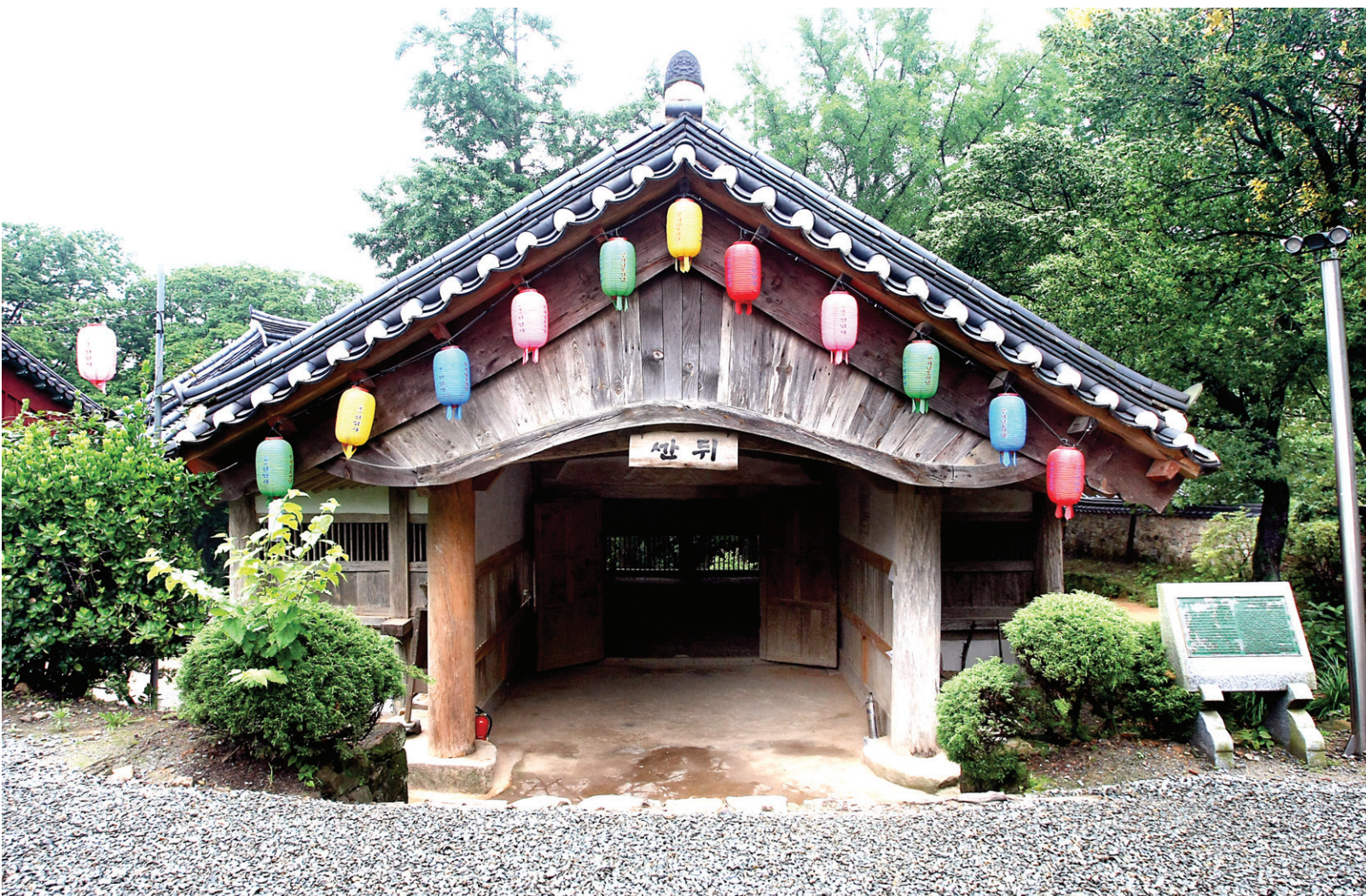
강원도 제132호 문화재 자료로 지정된 영월 보덕사 해우소(사진 왼쪽)와 선암사 뒷간(사진 오른쪽). 우리나라에서 가장 아름다운 절집 해우소들이다. 사찰 화장실은 해우소(解憂所)로 알려져 있으나 근래에 와서 붙여진 이름이고, 원래는 정량(淨廊), 청축, 뒷간이라고 부른다. 순환적 삶을 보여주는 대표적인 예다.

그러나 정말 맞는 말일까? 실제 보이는 세계에서 물은 위에서 아래로, 높은 곳에서 낮은 곳으로 흐른다. 그러나 물이 위에서 아래로 흐르지만 한다면 산에는 물로 가득 차 있는 물탱크 같은 것이 있어야 한다. 그러나 실제 그런 물탱크가 있을까?