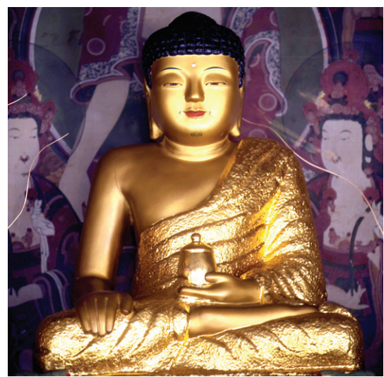
흥국사 약사전 약사여래

한참을 앉아있다. 맞은 편 설법전에는 극락구품도가 있다. 극락세계가 자세하게 그려져 있다. 약사전에 나와 설법전으로 갔다. 극락이 있었다. 약사여래의 약사발이 그냥 약사발은 아니었다. 흥국사는 템플스테이로 유명하다. 몇 해 전, 흥국사에서 쉽지 않은 템플스테이가 있었다. 이스라엘 대학생과 팔레스타인 대학생들이 함께한 템플스테이였다. 서로의 목숨을 주고받으며 살아가는 두 민족의 대학생들이 한국 땅 흥국사 마당에서 연등을 밝히고 물랐던 손을 마주잡던 그 밤이 생각났다. 그 때도 가을이 오고 있었던 것 같다. 흥국사는 최근 이색 템플스테이 '싱글파티 만남 템플스테이'를 운영하고 있다. 결혼적령기를 넘긴 미혼 남녀들의 만남을 위한 프로그램이다. 약사발을 든 약사여래가 있고, 극락구품도가 걸려있는 흥국사엔 '위로'가 있었다. 흥국사에도 태풍이 지나갔을 것이다. 태풍이 지나간 자리에서 여전히 흥국사는 사바를 위로하고 있었다.