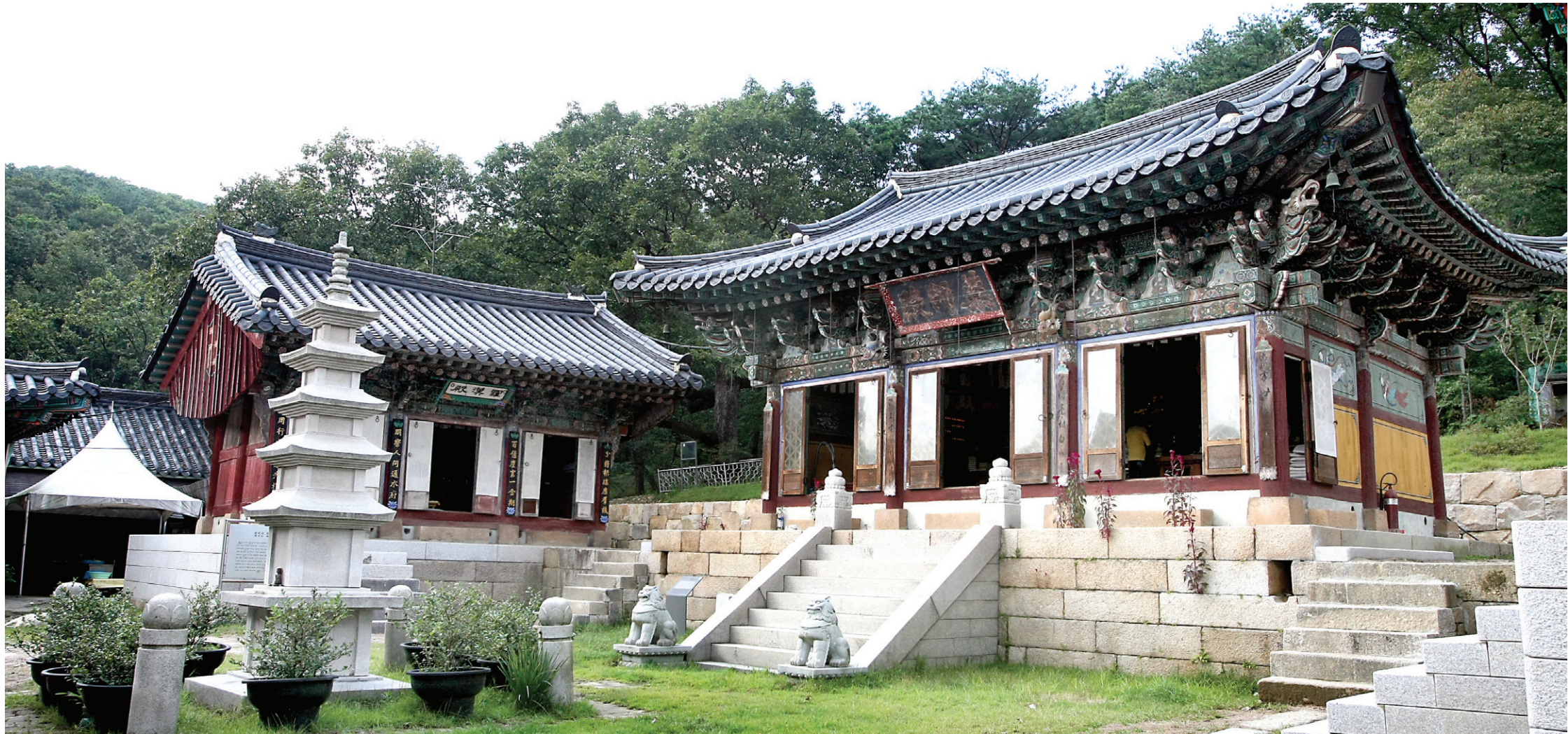
1300년전 원효 스님이 창건한 흥국사 약사전에는 약사여래가 약합을 들고 아픈 중생을 기다리고 있다. 먼저 와 앉은 불자 한 분이 약사부처님과 한참을 앉아 있다.