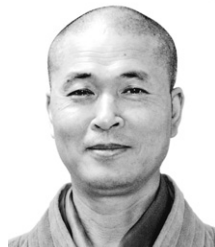
석우 스님의 조주록 선해