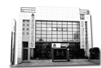
형산새마을금고 본점 전경