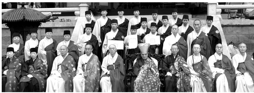
천태종은 9월 4일 구인사에서 승려수계 산림법회를 봉행했다. 이날 법회에서는 스님 14명이 배출됐다.