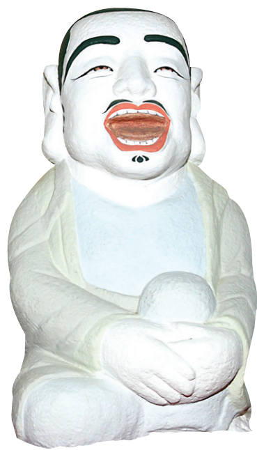
〈거조암 아난다 나한상〉

부처님의 말을 들은 정반왕은 손을 모아 합장했다. 그리고 눈을 감았다. 국상이 진행됐고, 부처님도 정성스럽게 아버지의 장례를 치렀다.