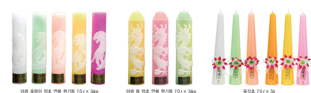
아랑 호랑이 양초 연병 원기등 7.0f x 34cm 아랑 용 양초 연병 원기등 7.0f x 34cm 육각초 7.0f x 34