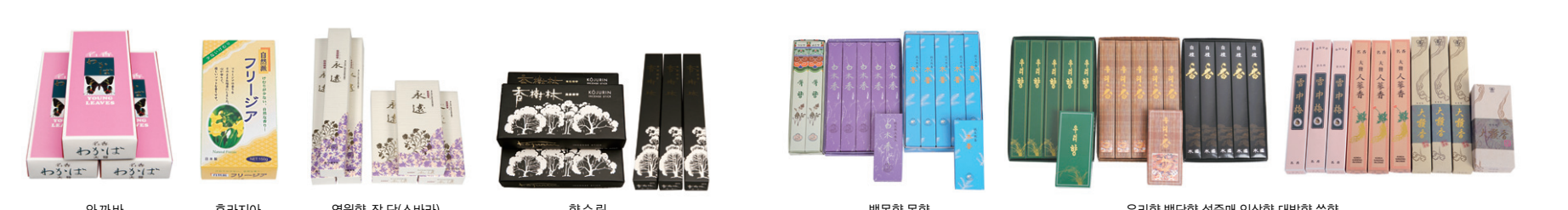
외계바 후리지아 연원향 정.단(소바라) 향수원 백옥향,목향 우리향 백단향,설중매,인상향,대발향,숙향