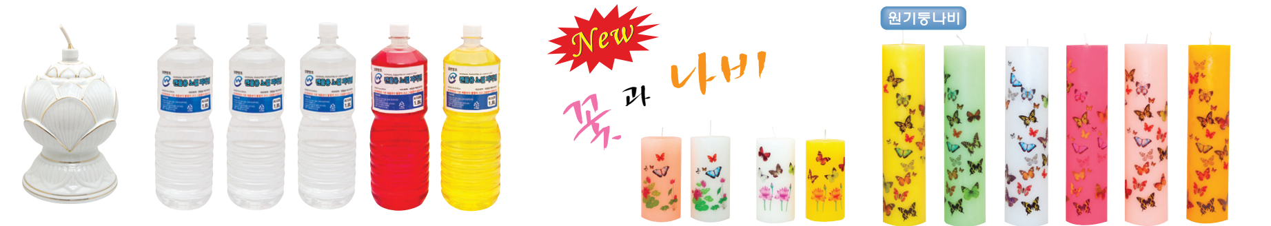
도자기 인등 인등용 파라핀 오일 : 국내산 원액 / 제조-삼환양초 3-6연꽃나비A 3-6연꽃나비B 노랑 연두 백색 핑크 원타 주황