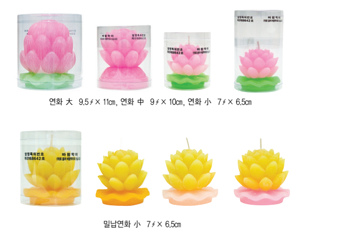
연화 대 9.5f x 11cm, 연화 중 9f x 10cm, 연화 소 7f x 6.5cm 밑납연화 소 7f x 6.5cm

삼환양초에서는 법당에서 부처님께 초 공양을 쉽게 올릴 수 있도록 연꽃 모양의 크리스탈 받침대와 밑납양초 신제품을 개발하였습니다. 밑납양초는 특수 PC컵을 이용하여 화재위험을 완벽하게 방지 하도록 설계되어 있어 법당 및 야외 어디서나 안전하게 초 공양을 올릴 수 있습니다. 이제 모든 불자님들의 마음을 담아 법당에서 1인 1등 연꽃밑납양초로 초 정염을 할 수 있습니다.